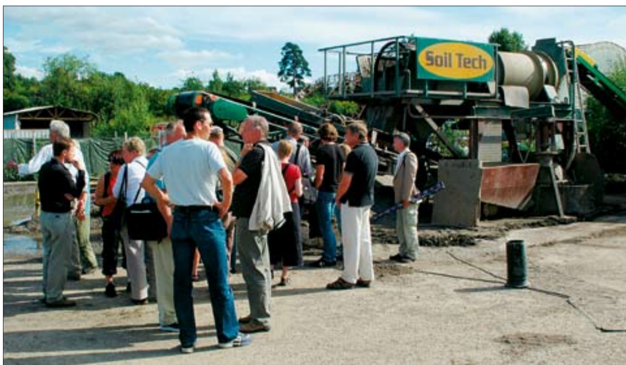
Intresset för behandlingen har varit mycket stort. Anläggningen i Vinsta har demonstrerats för kommunpolitiker, journalister och miljöansvariga. Artiklar har skrivits, lokalradion gjort reportage och regional TV har sänt ett inslag i ABC-nytt och TV4 Nyheterna.

Företaget är baserat i Stockholm, men är verksamt i hela landet.