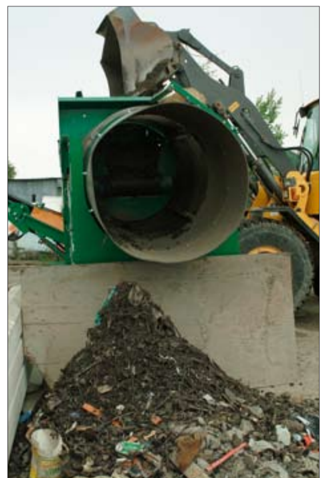
I en första grovsortering avlägsnas grenar, stenar, fordonsdelar och annat skräp som följt med vid uppsopning.