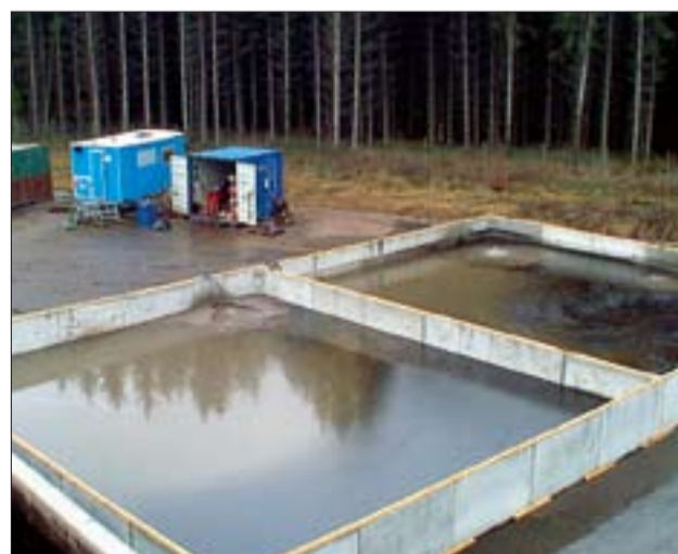
Sedimenteringsbassänger med lerslam på Sakab i Kvarntorp.